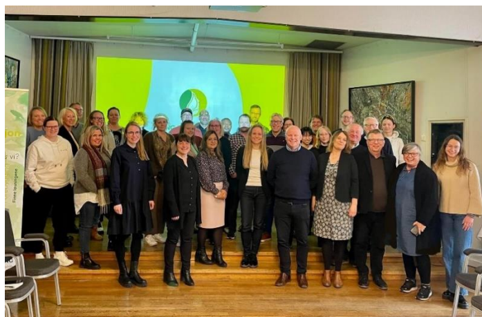
Bilde fra en av workshopene som ble gjennomført i mars

Det er de som har skoene på som best vet hvor de trykker. Hvis vi skal lykkes med å finne nye måter å jobbe på, trenger vi hjelp fra lokalsamfunnet. Det er de unge som best vet hvordan det er å være ung, og det er avgjørende å trekke veksler på de unges erfaringer. Et viktig prinsipp er «hvis det handler om meg, så ikke uten meg». Samtidig er det de som jobber med og er rundt de unge som har den beste innsikten i hvordan man jobber i kommunene, hva som er utfordrende og hva som faktisk virker.