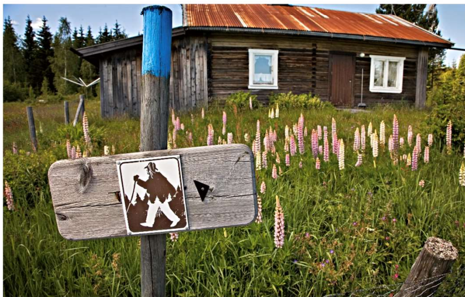
FINNSKOGLEDEN: Den 24 mil lange vandreleden strekker seg fra Morokulien i Eidskog til Trysil. Grenseområdet fra Eidskog i sør til Trysil i nord - mellom Glomma i Norge og Klarälven i Sverige.