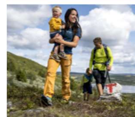
Valdres natur- og kulturpark