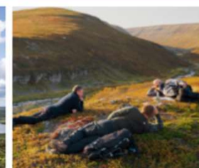
Varanger Arctic Norway