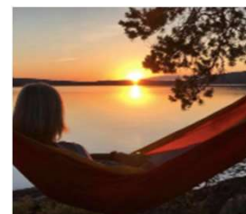
Finnskogen natur- og kulturpark