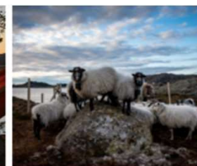
Fjordkysten Regional- og Geopark