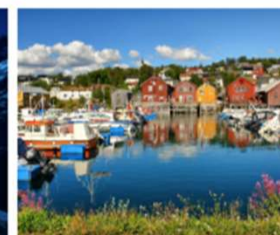
Okstindan natur- og kulturpark